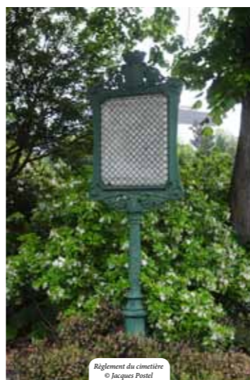
Règlement du cimetière © Jacques Postel