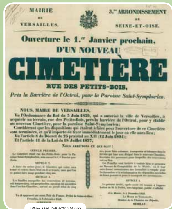
Affiche, 1840. Coll ACV, 2 M 1464

Notre-Dame et Saint-Louis, il est fermé aux sépultures en terrain ordinaire par arrêté municipal du 2 avril 1921 et la délivrance de nouvelles concessions de terrains arrêtée en 1958. En 1975, lors des opérations d'alignement de voirie communale pour l'élargissement des rues de la Bonne-Aventure et de la Ceinture, plusieurs emprises nécessitent le transfert de sépultures sur d'autres emplacements du cimetière. Un ossuaire des concessions abandonnées est construit en 1992 en même temps qu'un columbarium de 284 cases où sont placées les urnes cinéraires.