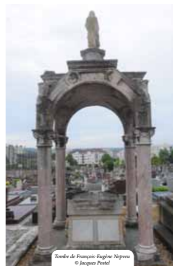
Tombe de François-Eugène Nepveu

Cimetière de Montreuil, 81 rue de la Bonne-Aventure, 78000 Versailles Tél : 01.39.51.31.41 Horaires d'ouverture : de 9H00 à 18H30 (mars-octobre)